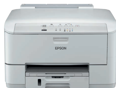
Modèle présenté : WP-4095 DN