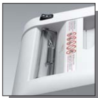
Volet de sécurité

Coupe fibres 4 mm Niveau de sécurité DIN 2 Documents internes.